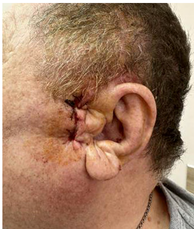
Рисунок 3. 1-е сутки после операции – фотография зоны операции Figure 3. Postoperative day 1. Clinical photograph of the surgical site

поддержки принятия решений. Современные работы в области машинного обучения демонстрируют возможность построения моделей, которые не только предсказывают индивидуальный риск (например, инфекции или резорбции кости), но и идентифицируют вмешиваемые факторы, на которые может повлиять хирург [24]. Такие системы, анализируя большой массив предикторов – от лабораторных показателей до данных