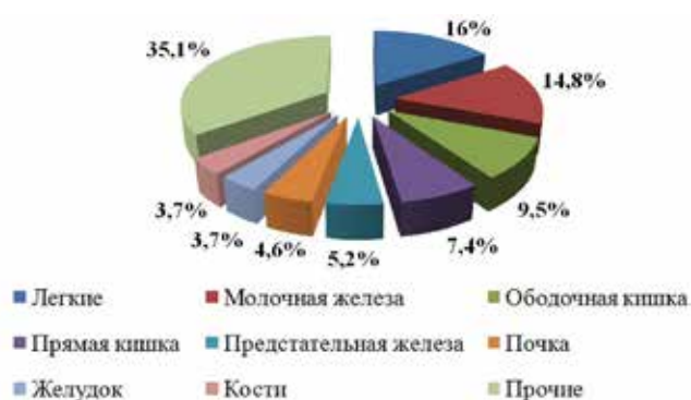
Рис. 1. Распределение больных, находящихся на стационарном лечении в ОПП, по локализации опухолевого процесса

Распределение больных злокачественными опухолями, находящихся в ОПП на лечение по локализации опухолевого процесса представлены на рис. 1., а по возрасту – в таблице 2.